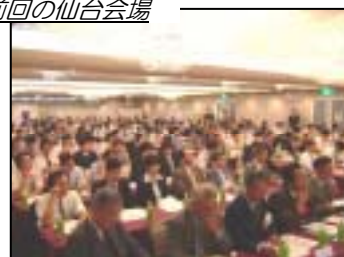
「全国縦断 GIS 実践セミナー」2004.9.2 ホテル白萩にて